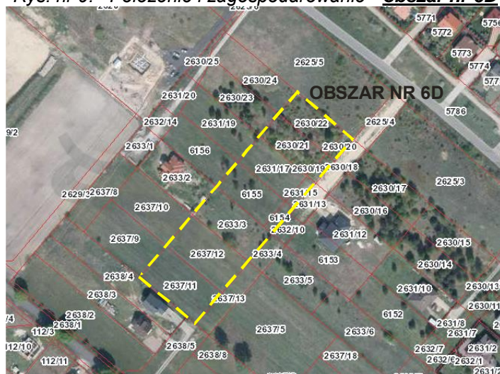
Rys. nr 9. Położenie i zagospodarowanie - obszar nr 6D

Obszar nr 6D położony jest, pomiędzy ulicami Szpitalna i Kasztanową, przy ulicy Żółtych Kłosów. Jest to teren w niewielkim stopniu zabudowany w części porośnięty roślinnością samosiewową. Obszar sąsiaduje z terenami, na których rozpoczęły się procesy inwestycyjne (zabudowa mieszkaniowa jednorodzinna).