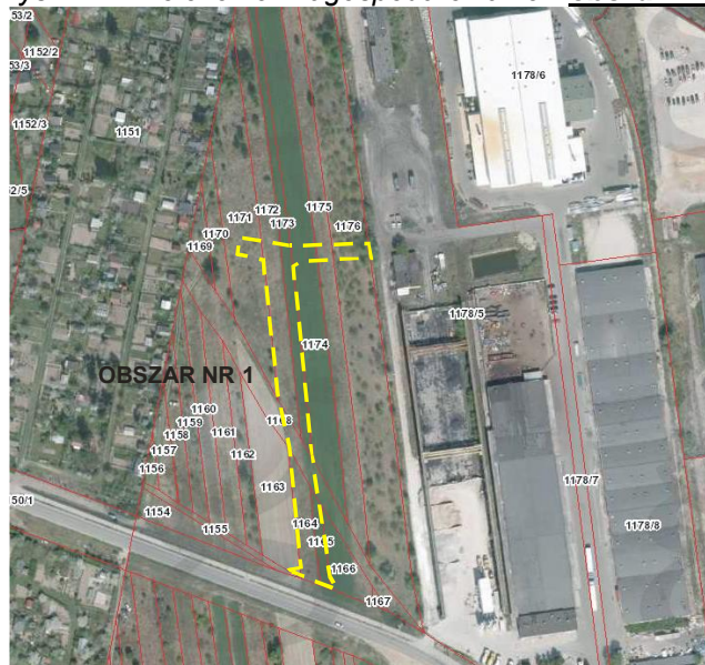
Rys. nr 1. Położenie i zagospodarowanie - obszar nr 1

Obszar nr 1 zlokalizowany jest na północ od ul. Leśnej jest to teren otwarty nie zainwestowany częściowo użytkowany rolniczo oraz odłogowany, na którym rozpoczęły się procesy sukcesji wtórnej. Jego bezpośrednie sąsiedztwo stanowią od północy, zachodu i wschodu tereny odłogowane i częściowo uprawiane w dalszym sąsiedztwie od wschodu występuje zabudowa produkcyjna a od zachodu ogródki działkowe. Od południa teren sąsiaduje z ulicą Leśną posiadającą utwardzoną nawierzchnię (asfalt).