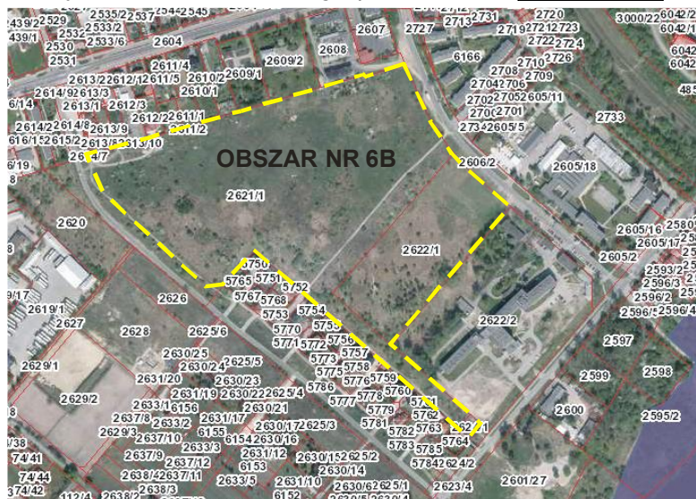
Rys. nr 7. Położenie i zagospodarowanie - obszar nr 6B

Obszar nr 6B położony jest pomiędzy ulicami Szpitalną a Komisji Edukacji Narodowej. Jest to teren niezainwestowany, porośnięty roślinnością samosiewową. Obszar sąsiaduje głównie z terenami zainwestowanymi.