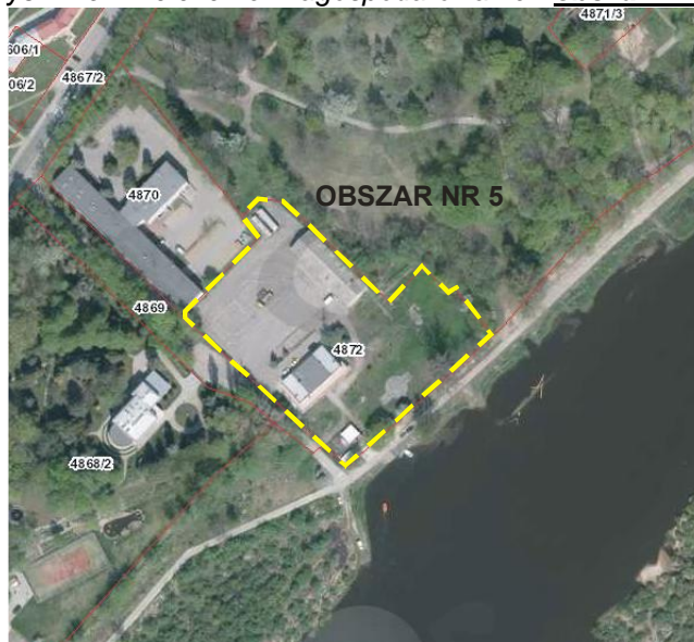
Rys. nr 5. Położenie i zagospodarowanie - obszar nr 5

Obszary nr 5 położony jest na południu miasta w sąsiedztwie rzeki Bug przy Aleja Róż. Bezpośrednie sąsiedztwo tego terenu stanowi budynek Urzędu Miejskiego w Wyszki oraz tereny otwarte, porośnięte różnogatunkową zielenią wysoka, rozciągające się wzdłuż rzeki Bug. Jest to teren zainwestowany.