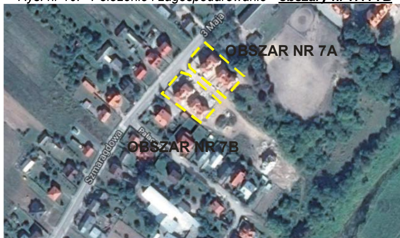
Rys. nr 10. Położenie i zagospodarowanie - obszary nr 7A i 7B