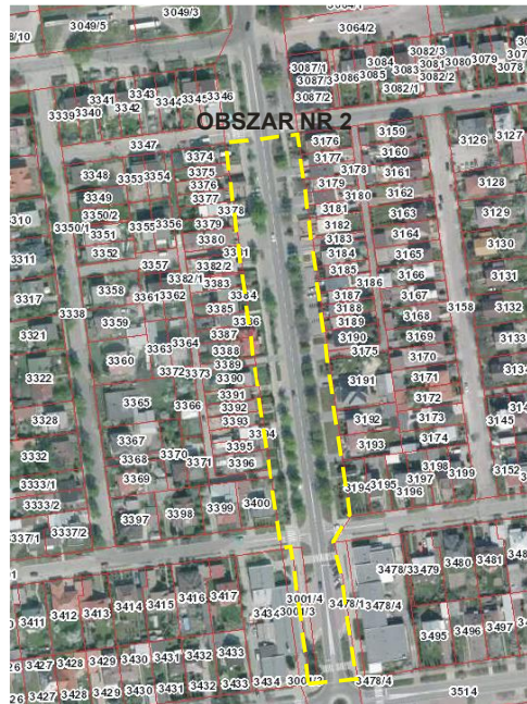
Rys. nr 2 Położenie i zagospodarowanie - obszar nr 2