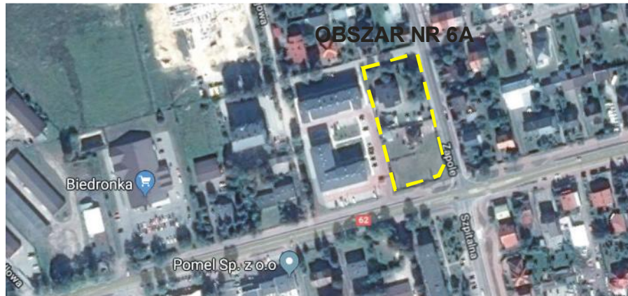
Rys. nr 6. Położenie i zagospodarowanie - obszar nr 6A